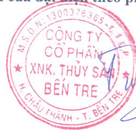
ĐẶNG KIẾT TƯỜNG Chủ tịch HĐQT

Xác nhận của đại diện theo pháp luật của Công ty